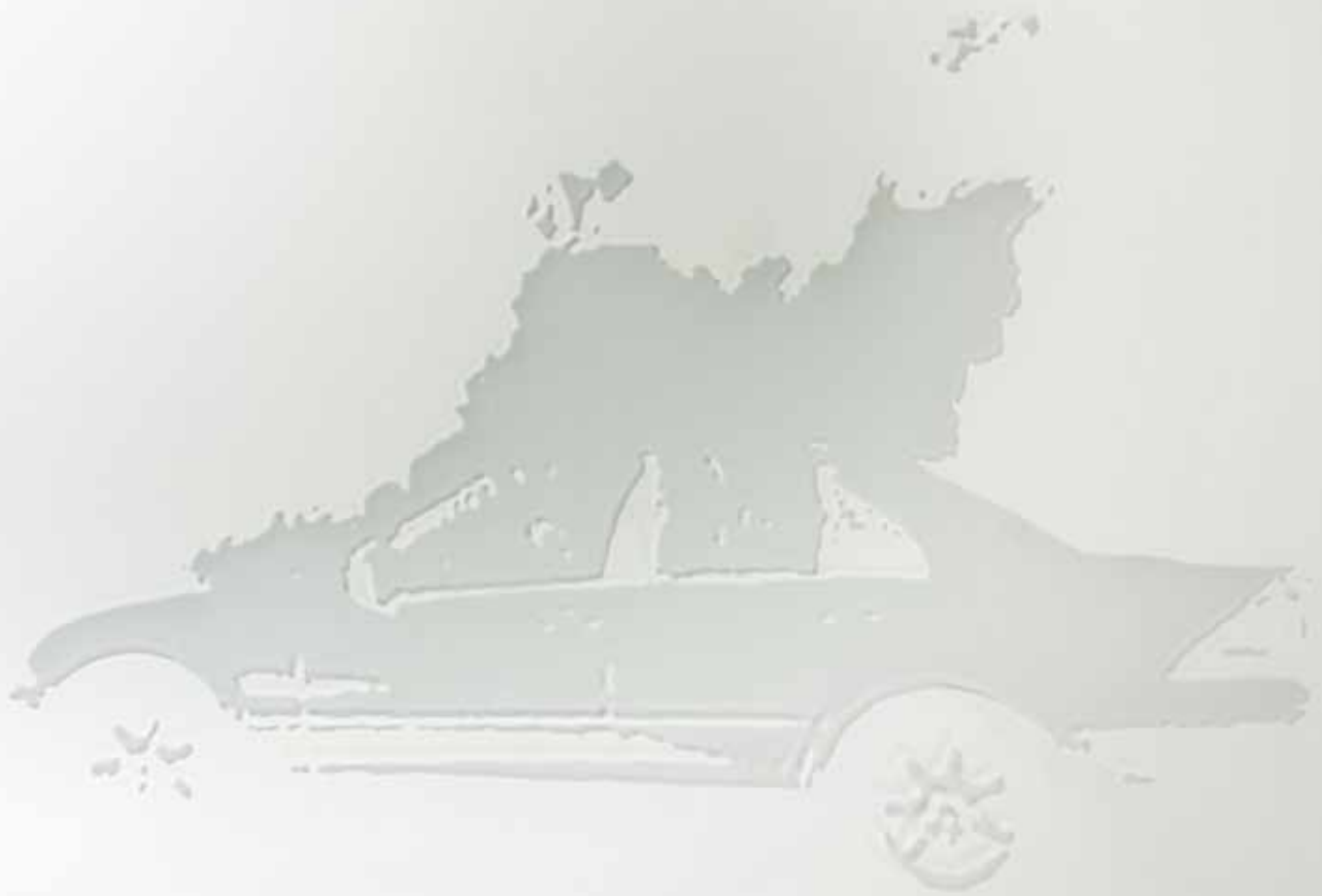
Göbel «o. T. (Burning car)» (Detail) rechte Seite: Scharfbier «Alle sieben Jahre» (Detail)