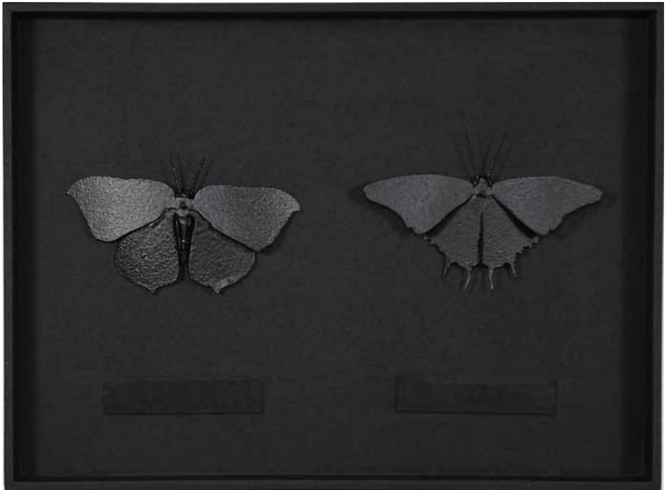
Göbel «Lepidoptera V» linke Seite: Göbel 80 Arbeiten aus der 100-teiligen Serie «Lepidoptera (aus der Serie der Pretiosen)»