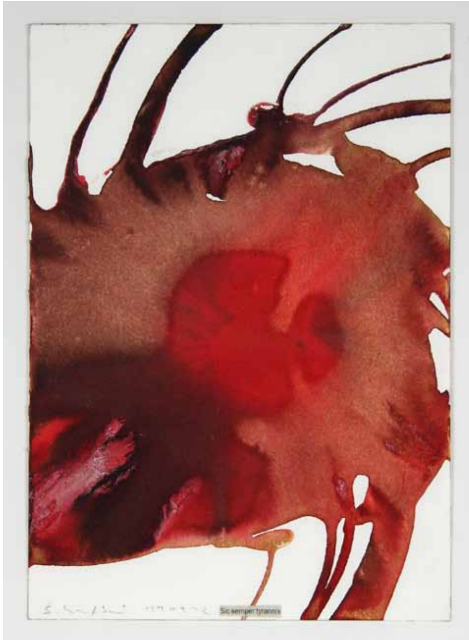
Scharfbier «Sic semper tyrannis» rechte Seite: Scharfbier «Elfkommazwei Kilo Widerstand (Sic semper tyrannis)»