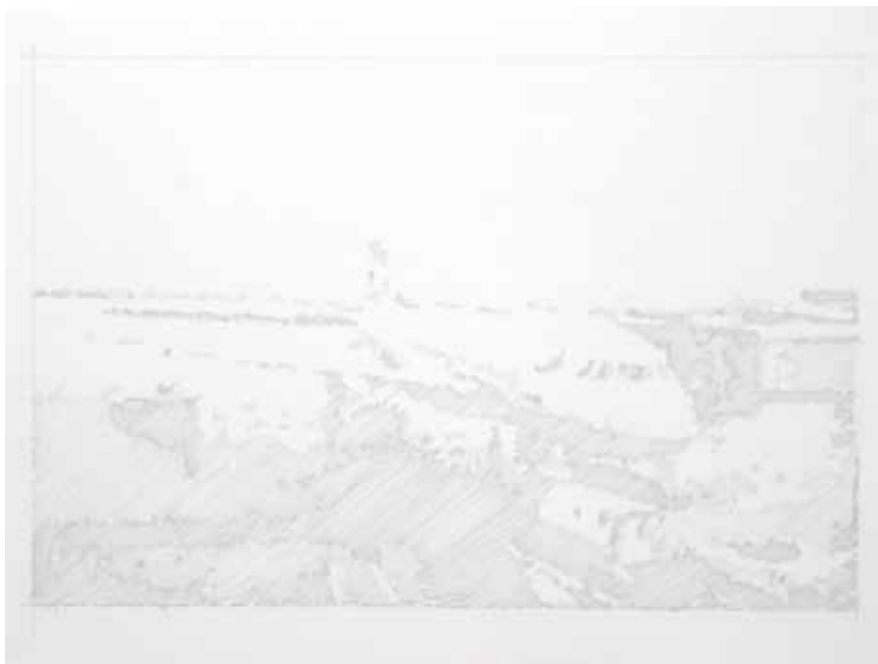
Göbel «o. T. (Destinations VIII)», «o. T. (Destinations II)» linke Seite: Scharfbier «Warme Melodie»